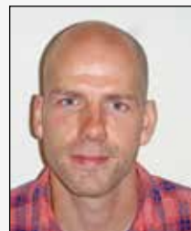
MV Max Vejen biologi kemi