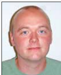
MP Morten Poulsen