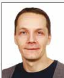
RD Rasmus Damkilde idræt historie samfundsfag