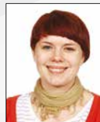
LJ Lone Amtoft Jacobsen fransk oldtidskund- skab græsk