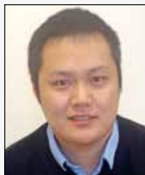
MPM Morten Park Moustén engelsk