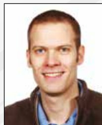
CN Claus Nivaa billedkunst dansk