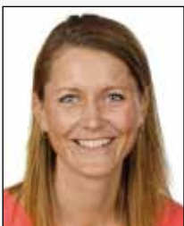
LD Line Damgaard Ørsnes