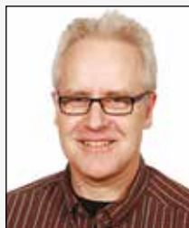
AJ Allan Juul engelsk musik