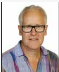
AJ Allan Juul engelsk musik