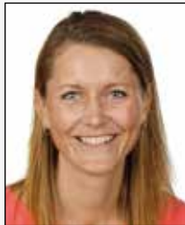
LD Line Damgaard Ørsnes