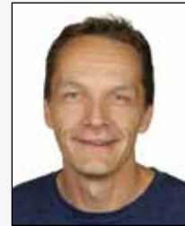
RD Rasmus Damkilde idræt historie samfundsfag