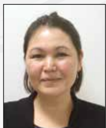
LFB Line Faden-Babin