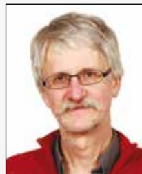
OB Ole Wilhelm Quistgaard Bay datalogi geografi historie samfundsfag matematik