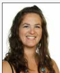
MAP Marina Angélica Porto