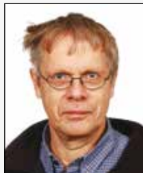
JK Jens Kampmann billedkunst design engelsk